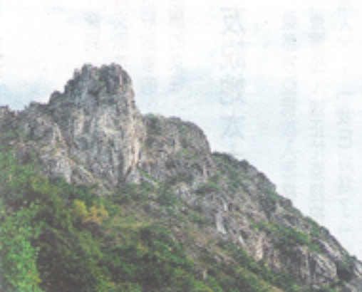
▲代表香港精神的沙田獅子山

的而且確，擁有複雜多變的地貌，是香港的驕傲。果洲羣島的六角柱石、沙田的望夫石、西貢破邊洲的海蝕柱，還有東平洲層層疊疊的沉積岩、荔枝莊的火山沉積物，以及世間罕有、由高溫火山灰凝結而成的橫洲角洞柱石等。各種地貌背後，都記載着屬於香港歷史和故事，猶如一座大自然博物館。「其實香港的地貌勝景，足以榮登世界排名榜。」