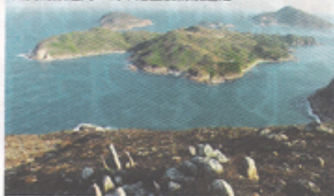
西貢的旗點門，為本港重要的航道之一。