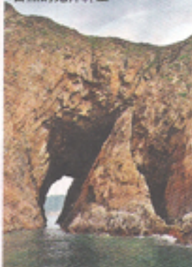
從西貢的橫洲角洞，盡見大自然的鬼斧神工。