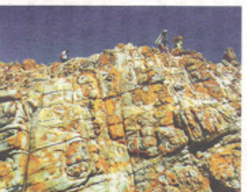
▲「金爐絕壁——火石洲」，「香港八大地貌勝景」攝影比賽公開組優異獎。