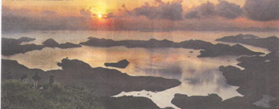
「印洲墟觀日——吊燈籠」，「香港八大地貌勝景」攝影比賽公開組優異獎。