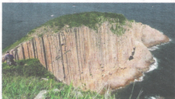
▲西貢破邊洲的石柱，經過長年累月給巨浪侵蝕，形成如此壯觀奇景。