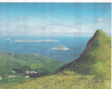
▲位於清水灣半島的釣魚翁，由火山岩組成。